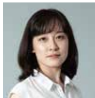
レニ・リーフェンシュタール 今泉舞